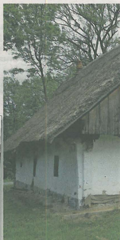
4 Simoničeva domačija je največja znamenitost kraja.