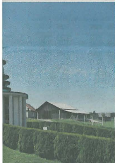
arhitekturna pripoved Krajnčeve družine.