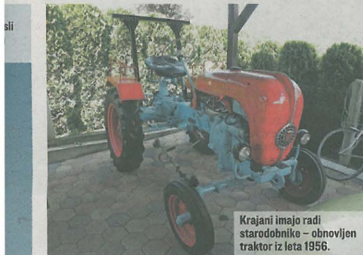
Krajani imajo radi starodobnike – obnovljen traktor iz leta 1956.