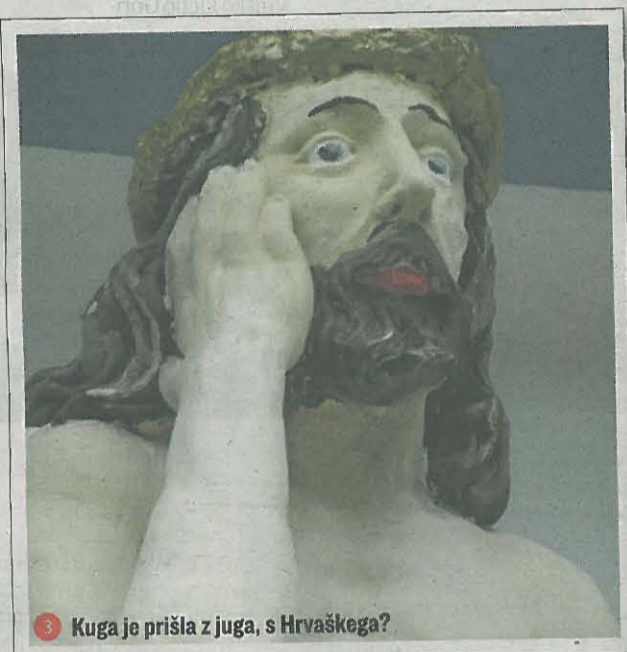
3 Kuga je prišla z juga, s Hrvaškega?