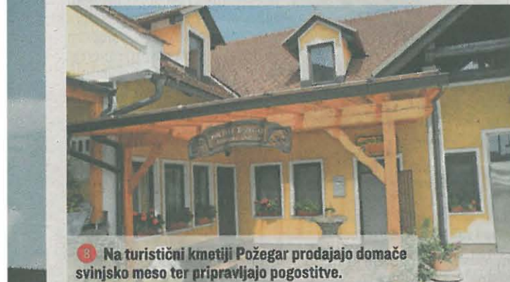
Na turistični kmetiji Požegar prodajajo domače svinjsko meso ter pripravljajo pogostitve.

2 Cerkev svetega Bolfenka, zraven sta Gostišče pri Sivi čaplji in občina – vse je na kupu.